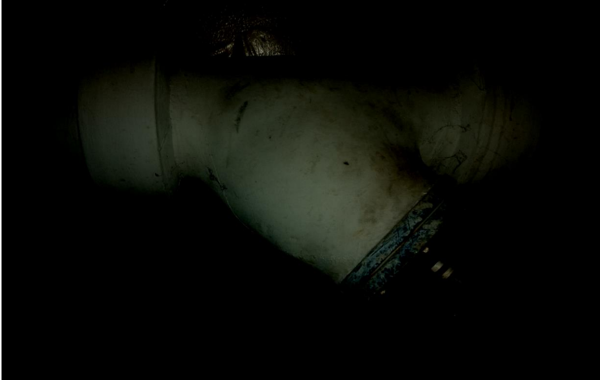
Δ) ΑΝΤΛΙΑ GRUNDFOS 30 KW